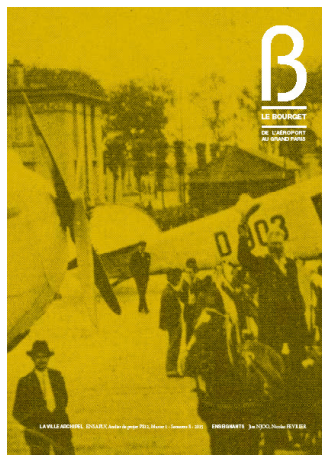
Exemple d'Atlas _ La ville aéroportuaire

http://www.fevriercarre.fr/wp-content/uploads/2014/06/EXPO_atlas.pdf http://fevriercarre.fr/wp-content/uploads/2015/06/BOURGET_atlas1.pdf